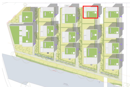
Plan de localisation