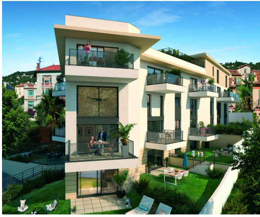
Villa COMTI 15 Avenue de Reims - NICE