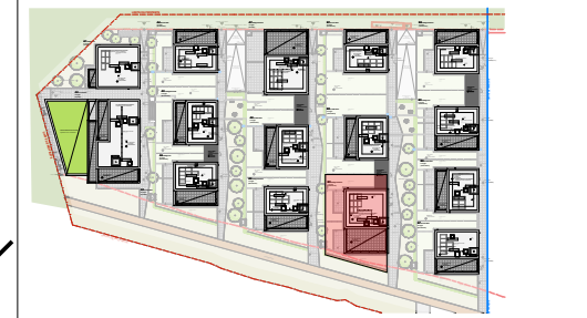
Plan de masse